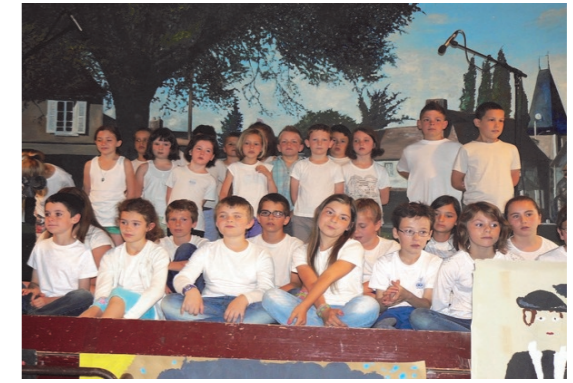
Kermesse des écoles