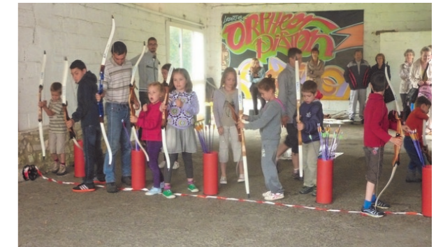
Séance Tir à l'Arc