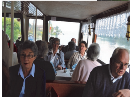
Croisière sur la Seine