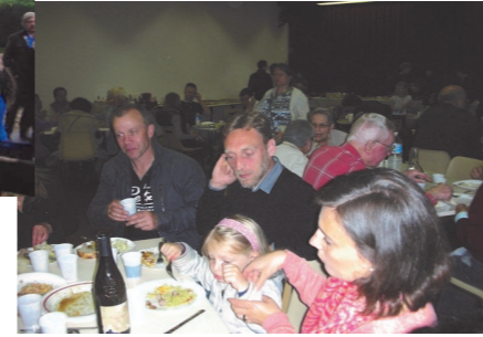
Fête des voisins