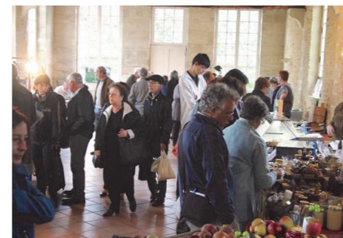
Marché au foie gras