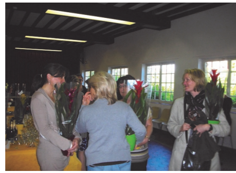
Fete des mères