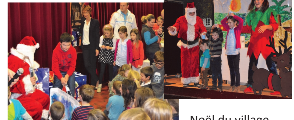
Noël du village