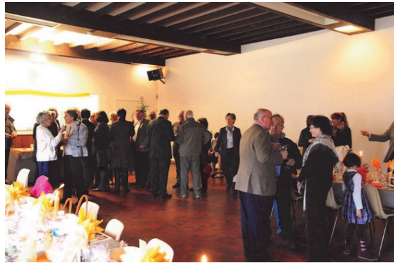
Repas des anciens