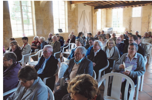
Concert au château