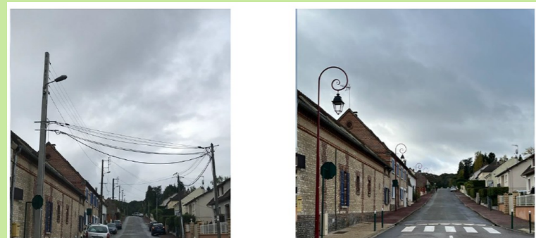
Exemple de réalisation (avant / après)

Tous ces travaux entraîneront un embellissement de notre cadre de vie avec la suppression des rangées de câbles aériens des deux côtés de la route, l'amélioration de l'éclairage public avec des économies pour la commune grâce à la mise en place de lampes à LED et la sécurisation du réseau (plus de chutes de branches, d'arrachement par le passage d'engins).